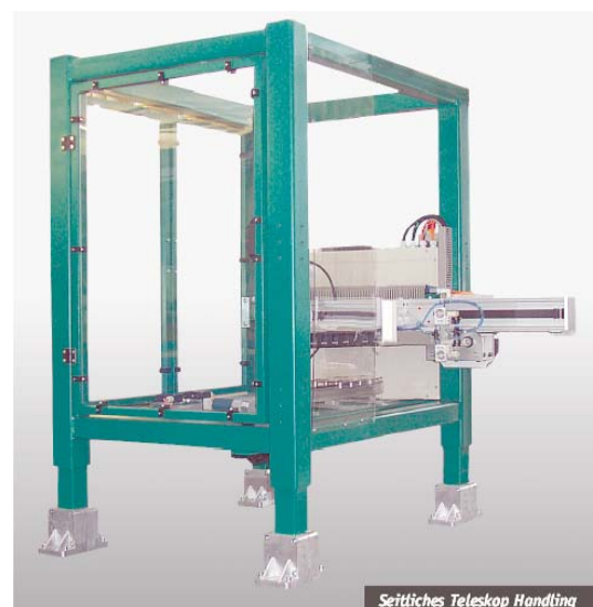
Seitliches Teleskop Handling